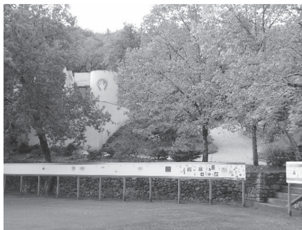
写真1 展示館の外観

カオールの近くのペッシュメルル洞窟は実物の先史絵画が見られる洞窟の1つで馬の絵と人の手形で有名である。人数制限があり前から予約を入れておかないと見学は難しい。13時15分のツアーに予約を入れておいたのだが予定より早く着いて人数に空きが